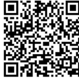
オンライン参加者用 二次元コード