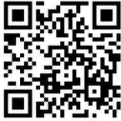
会場参加者用 二次元コード