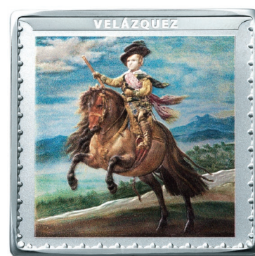
プラド美術館200周年記念コイン