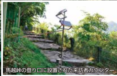
馬越峠の登り口に設置された来訪者カウンター

熊野古道定期の寄付金は、 来訪者カウンター、 清掃品の購入費用等、 熊野古道の保全の ために活用しています。