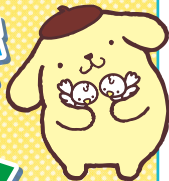
三十三フィナンシャルグループ 公式キャラクター「ポムポムプリン」 ©'96-'19 SANRIO APPR.No.G601074